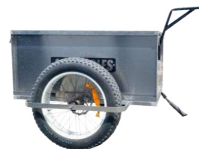
11 Remorque agricole

Cadre acier, ridelles amovibles, surface 130 x 88 cm. Charge max 60 kg. Pneus 20", béquille intégrée. Signalétiques réfléchissantes.