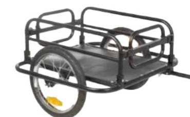
Remorque à ridelles

Cadre en acier, toile étanche, surface de transport 83 x 45 x 38 cm. Charge max 60 kg. Pneus 20" x 4.0, attache sur axe de roue.