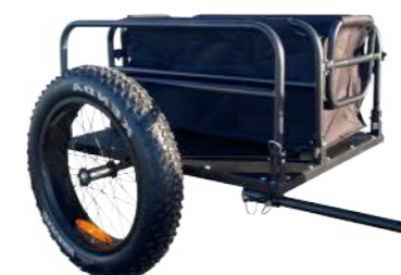
2 Remorque utilitaire

Cadre acier, ridelles amovibles, surface 130 x 88 cm. Charge max 60 kg. Pneus 20", béquille intégrée. Signalétiques réfléchissantes.